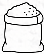
MAXI SACO 1.000 KILOS