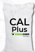
SACO 25 KILOS